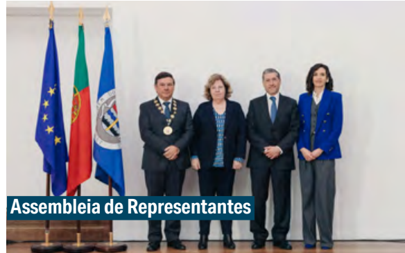
Assembleia de Representantes