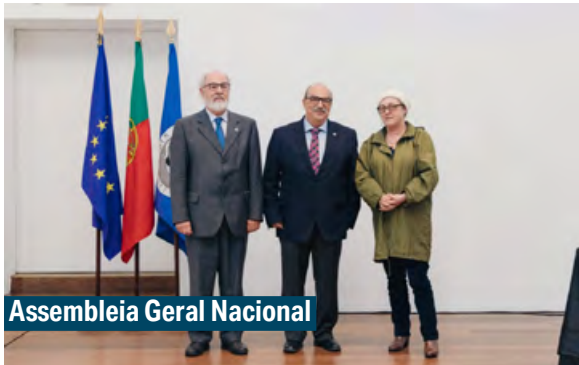
Assembleia Geral Nacional

Decorreu no Salão Macau da Fundação Oriente em Lisboa, no dia 15 de abril de 2025, a cerimónia da tomada de posse dos Órgãos Nacionais e da Secção Regional do Sul para o mandato 2025-2028, designadamente Bastonaire, Mesa da Assembleia-Geral Nacional, Conselho Diretivo Nacional, Mesa da Assembleia de Representantes, Conselho Fiscal Nacional, Conselho de Supervisão, Conselho Jurisdicional, Conselho Disciplinar Nacional e Conselho da Profissão.