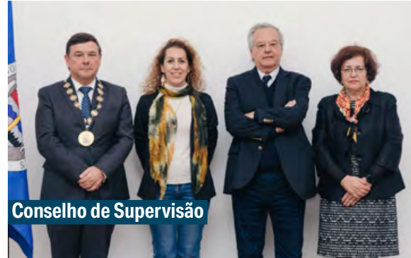
Conselho de Supervisão