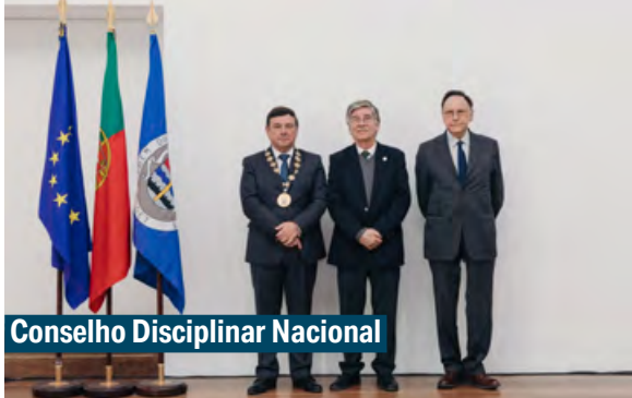
Conselho Disciplinar Nacional