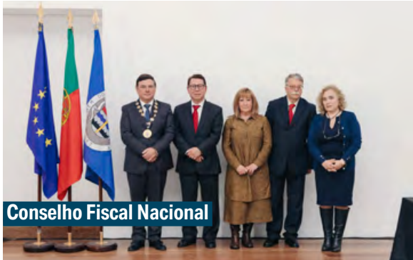
Conselho Fiscal Nacional